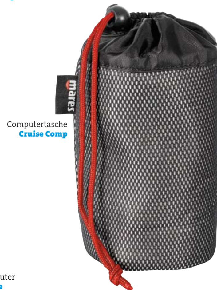
Computertasche Cruise Comp