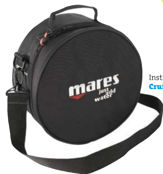
Instrumententasche Cruise Reg