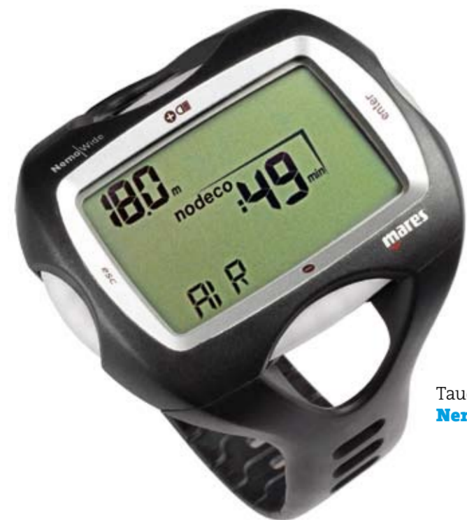
Tauchcomputer Nemo Wide