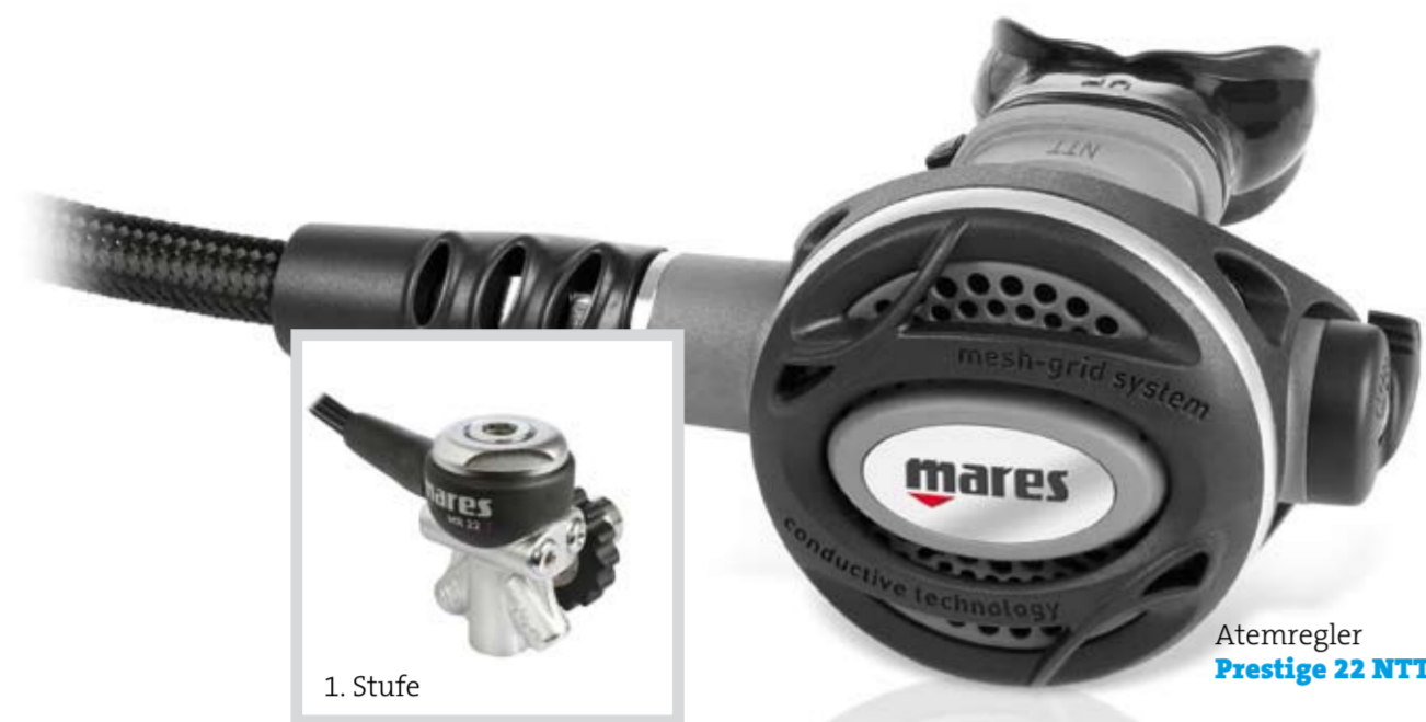
Atemregler Prestige 22 NTT