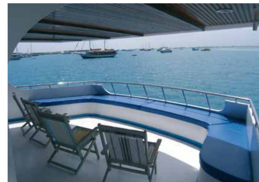
Ausgangspunkt für Safaris auf der MV Sheena: Das Premium-Resort Medhufushi im abgelegenen Meemu-Atoll.