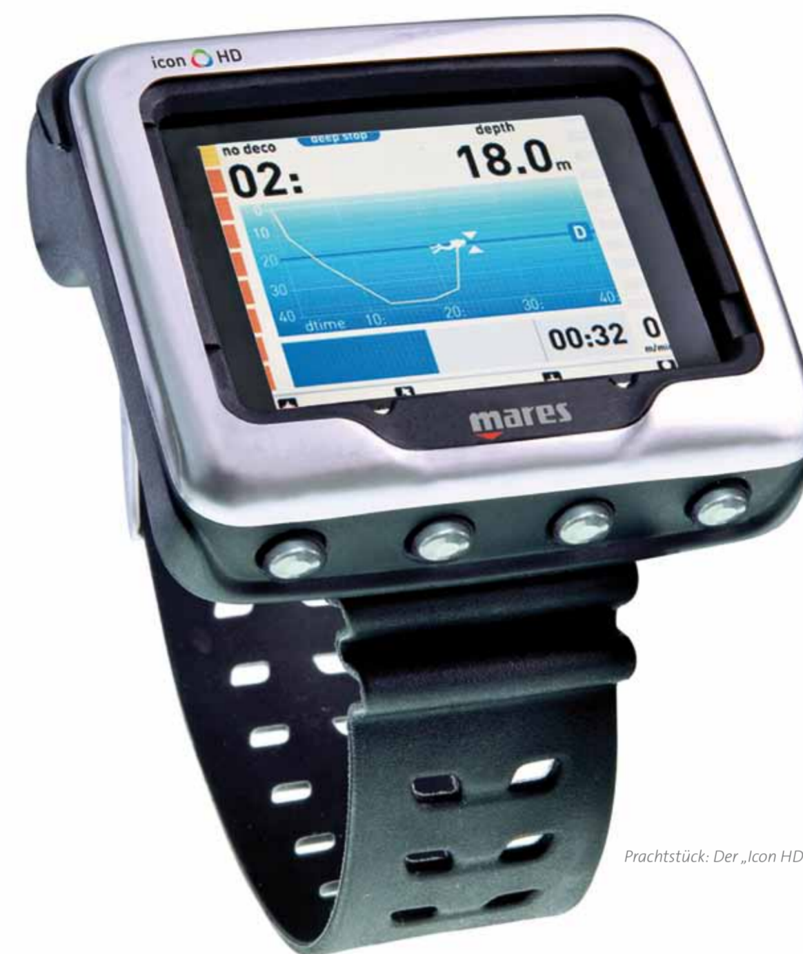
Prachtstück: Der „Icon HD“ mit der „Profile“-Anzeige.