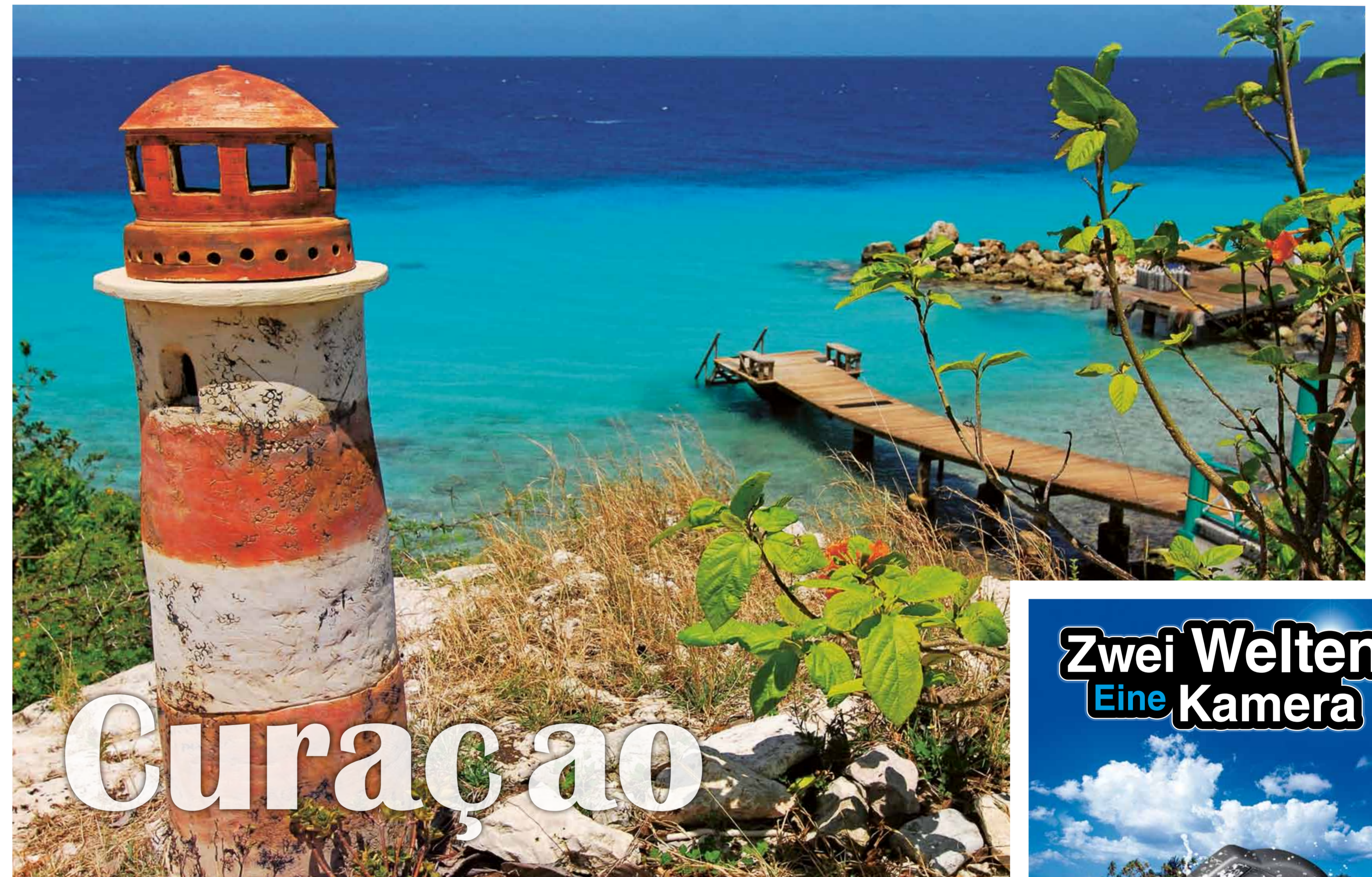
Text Sybille Gerlinger

Impressum Herausgeber: ORCA Reisen GmbH Redaktions- und Projektleitung: Sabine Wechselberger Grafik: Finewerk GmbH, info@finewerk.de Autoren und Fotografen: Conny Thane, Matthias Bergbauer, Sabine Wechselberger, Gerald Nowak, Sybille Gerlinger, Eckhard Krumpolz Druck: Bechtle Druck&Service, Esslingen Copyright 2010 by ORCA Reisen GmbH